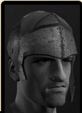
А так выглядит среднестатистический охранник локации

На острове Крimea разразилась борьба за господство на острове. В последнее время одну локацию переотниают до пяти раз за день. В городах уже поднимается суета по этому поводу.